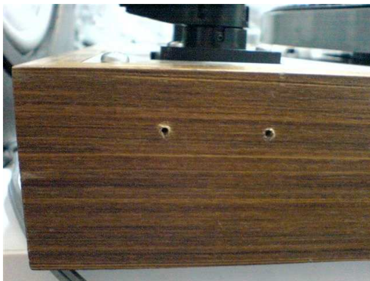
Particolare dei fori

Misure adattabili a tutti i modelli Thorens con base da 43cm x 34cm