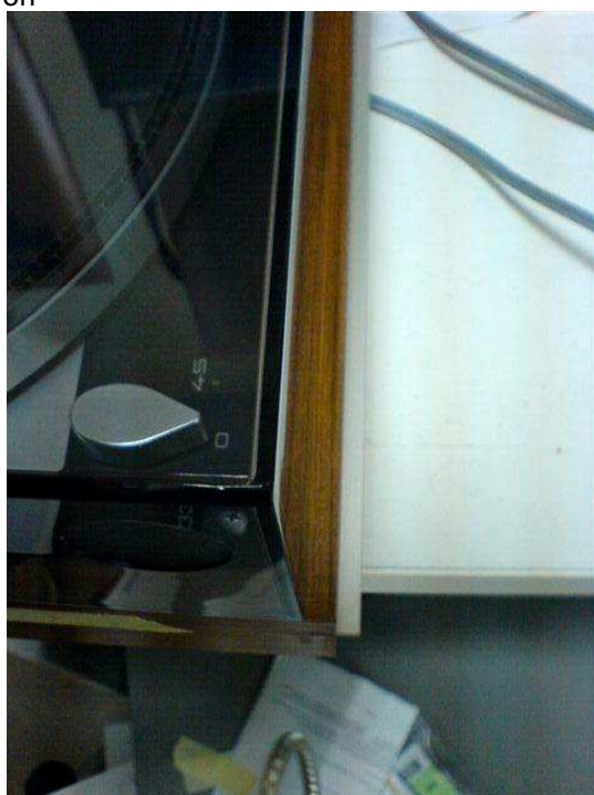
vista frontale del montaggio finale